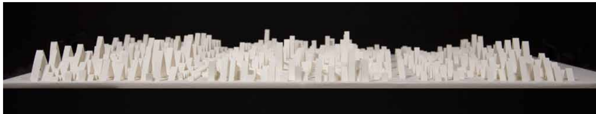
↓ Paisaje privado ( Perfil I) 2019 Fotografía 20 x 100