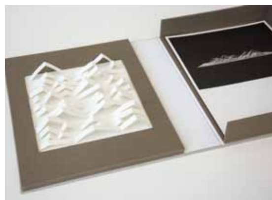
← Paisaje Privado 2019 Libro de artista 24 x 30,5 x 6,5