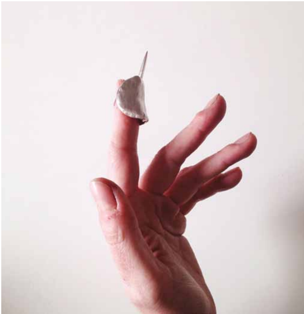
Dedal para aguafuerte 2019 Joyería artística 4,5 x 1,5