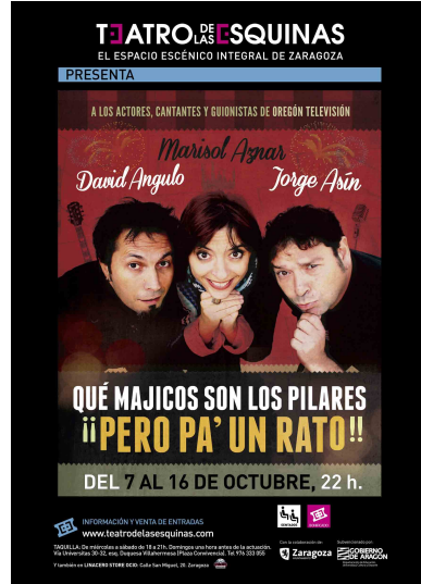
2016 'QUÉ MAJICOS SON LOS PILARES PERO PA' UN RATO' *