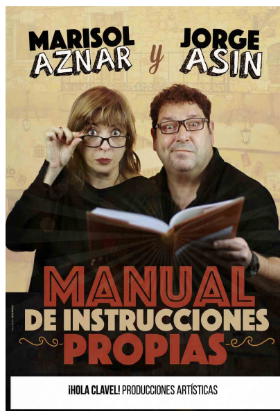
2018 'MANUAL DE INSTRUCCIONES PROPIAS'