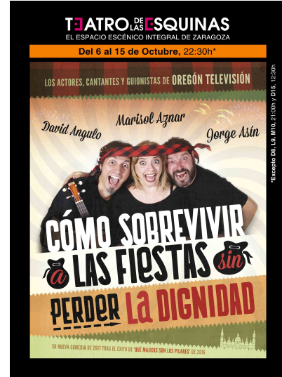
2017 'CÓMO SOBREVIVIR A LAS FIESTAS SIN PERDER LA DIGNIDAD' *