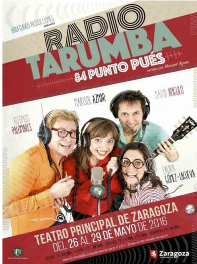
2016 'RADIO TARUMBA (84. PUES)'