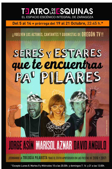
2018 'SERES Y ESTARES QUE TE ENCUENTRAS PA' PILARES' *