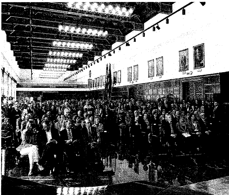
El salón de Recepciones del Ayuntamiento recibió ayer a las autoridades y entidades sociales. D. MARCOS