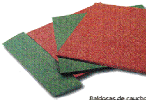
Baldosas de caucho