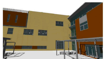
ACCESO A ANDADOR JOSE CASTAN TOBEÑAS