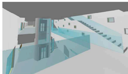
PLANTA PRIMERA - ESTAR DE BIBLIOTECA Y ESCALERA A PLANTA SEGUNDA