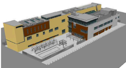
VISTA AEREA ESTE