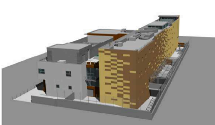
VISTA AEREA OESTE