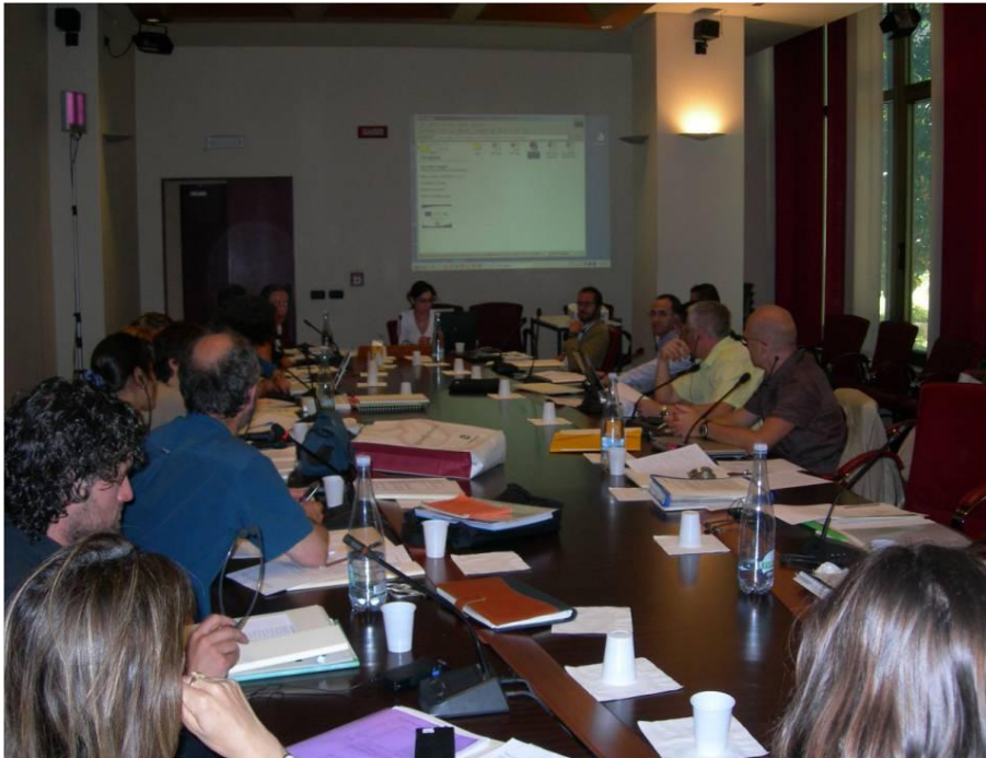
Fig 1. Sesión de trabajo de la Comisión 21