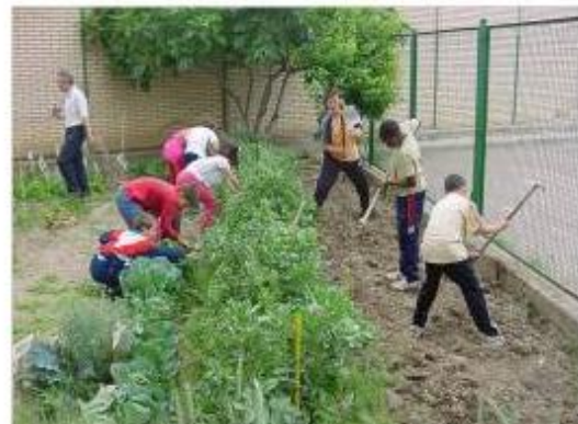
Fig 5. Escolares experimentando sobre ahorro de energía y cultivando su huerto escolar