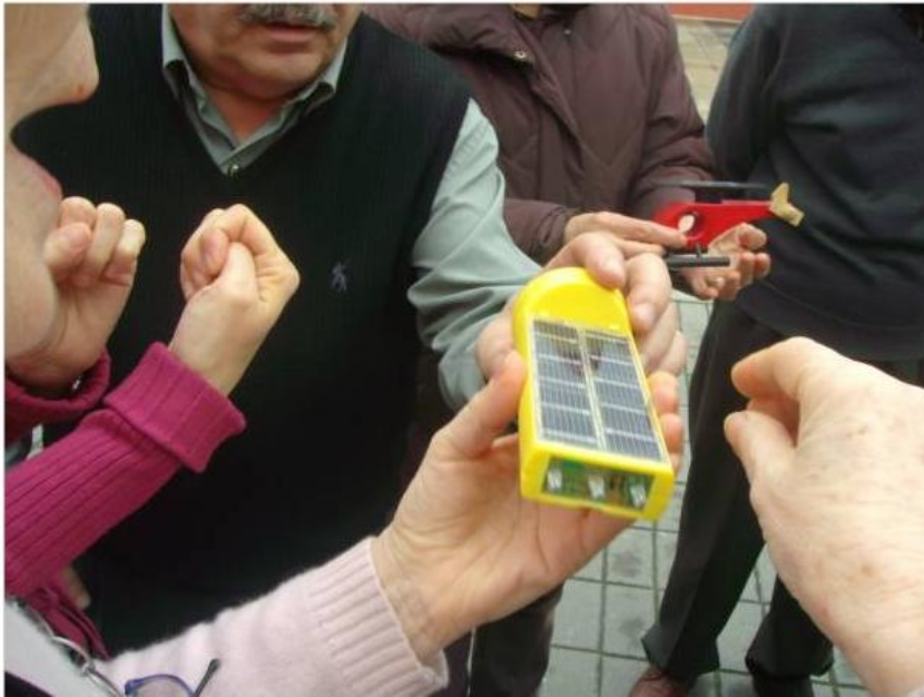
Fig 7. Adultos informándose sobre cargadores solares de baterías

Cada programa, y sobre todo los de carácter educativo y de sensibilización, tienen una evaluación propia de carácter interdisciplinar y está incluido en el Sistema de Indicadores (39) que permite hacer una evaluación global a través de la huella ecológica.