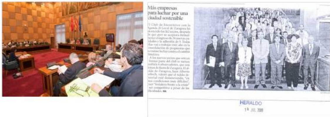
Fig 6. Pleno del Consejo de la Agenda 21 Local. Adhesión de nuevas empresas

200 empresas comprometidas voluntariamente, en el seno del Club de Encuentros con la Agenda 21 Local, para lograr pautas sostenibles en la fabricación y distribución. (Fig. 6)