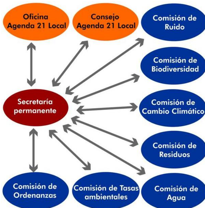
Fig 3. Transversalidad de la Agencia de Medio Ambiente y Sostenibilidad

La participación de la ciudadanía y la sociedad civil se realiza a través del Consejo Local Agenda 21, del que la Agencia es Secretaría Técnica. (Fig 3)