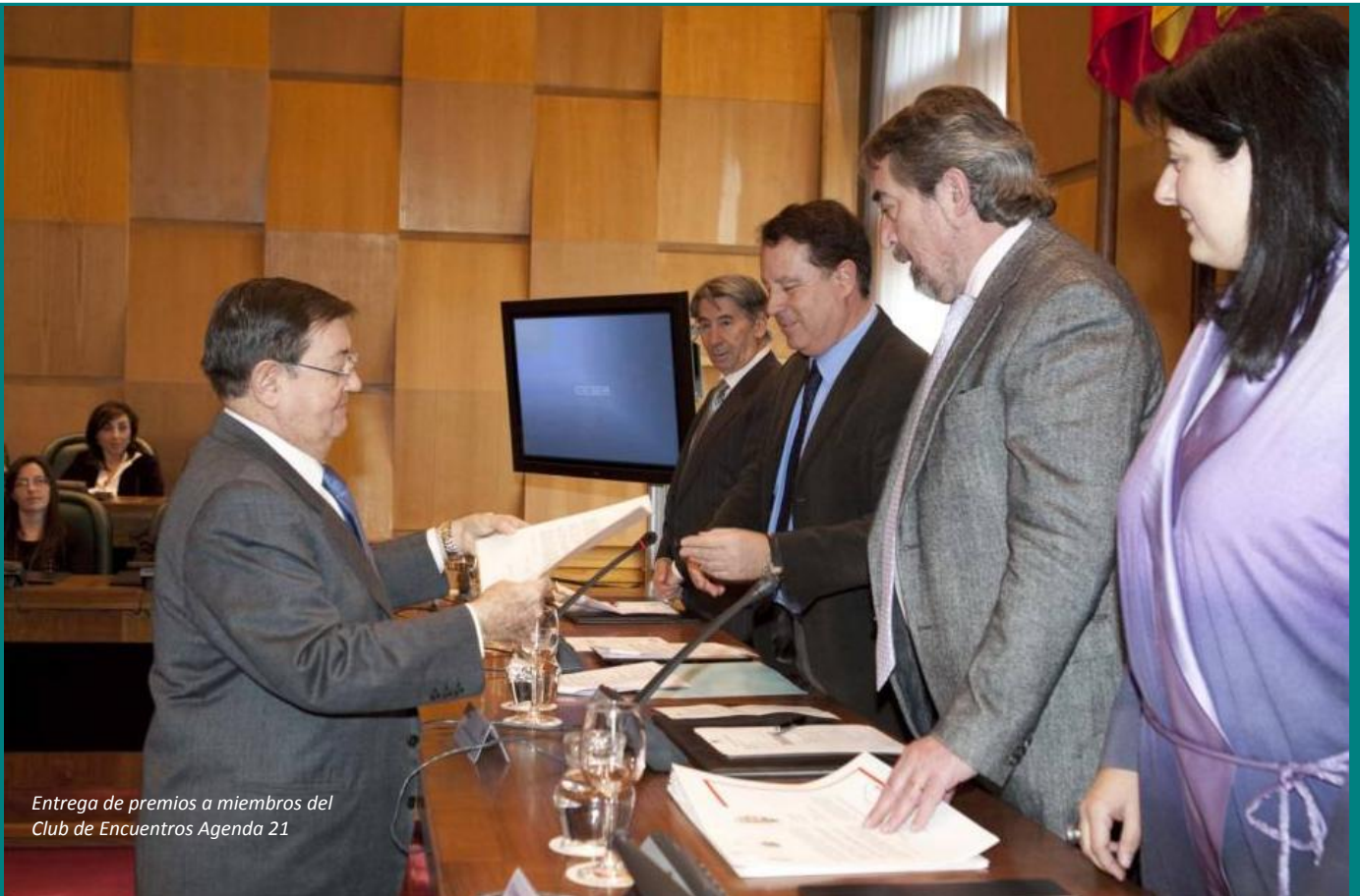
Entrega de premios a miembros del Club de Encuentros Agenda 21