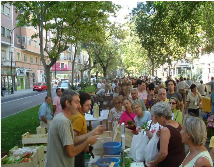
Fig 2. Mercado agroecológico de ProductosKm0