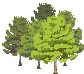
Pinares de Venecia-Monte de Torrero

Una vez que has visitado los dos espacios, asigna estas características a uno de los espacios para comparar: