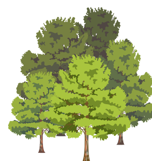
Vedado de Peñaflores