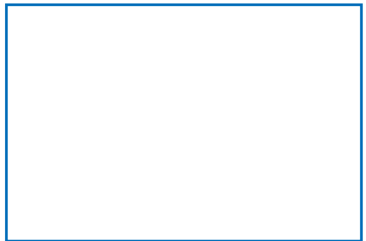
El Gállego en