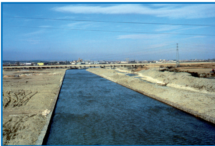
El Gállego en 1986