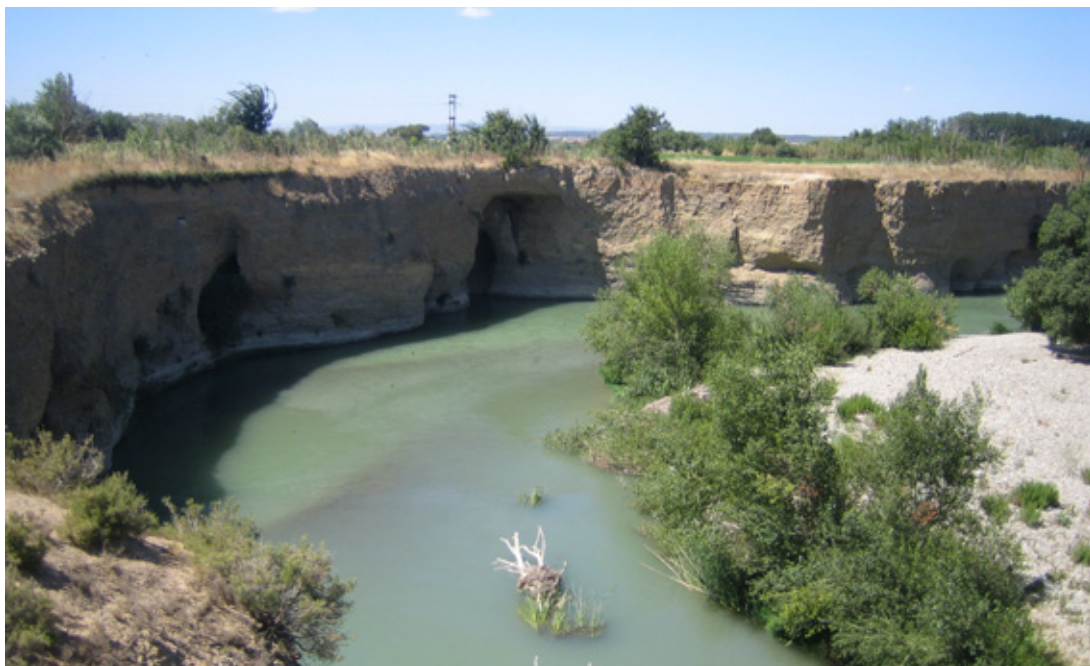
Peña del Cuervo