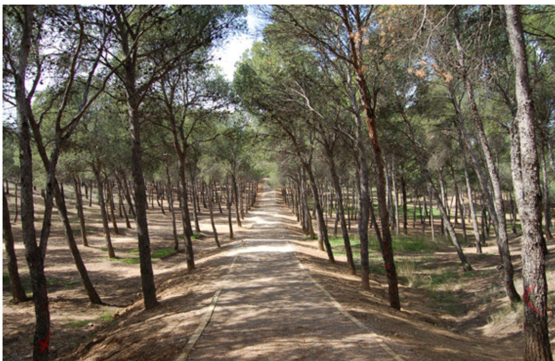
Monte de Torrero