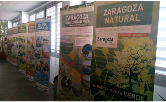
Centro Cívico Santa Isabel