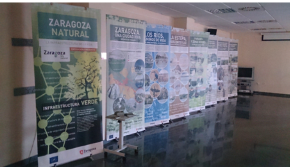
Centro Cívico Antonio Beltrán Martínez. Garrapinillos

Entre el 13 de febrero y el 30 de abril de 2015 la exposición "Zaragoza Natural. La infraestructura de la vida" desarrolló su primera fase de dinamización. Durante 10 semanas recorrió el Centro Ambiental del Ebro (4 semanas) el Centro de Historias de Zaragoza (1 semana), el Edificio Seminario del Ayuntamiento de Zaragoza (1 semana) y la Biblioteca CUBIT (4 semanas, 2 de ellas con atención y 2 sin ella ).