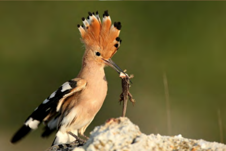
Lechuza, ratón de campo, gargas, martín pescador, sabina en Peñaflores and abubilla. 6 photographs by Jesús Ángel Jiménez Hérce from the 88 that you can find on the website of the LIFE Zaragoza Natural project of the Zaragoza City Council.