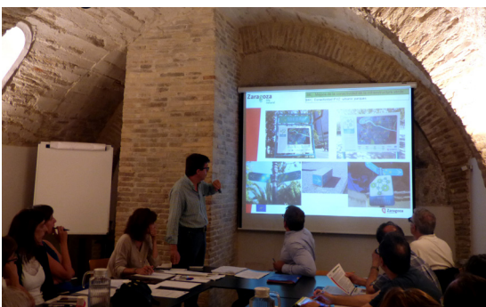
Miembros de la Comisión de Biodiversidad debatieron sobre diferentes proyectos

y han presentado sus comunicados técnicos relativos al trabajo desarrollado en LIFE Zaragoza Natural.