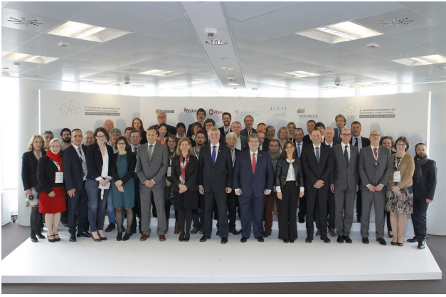
Los participantes en la 8ª Conferencia de Ciudades Sostenibles