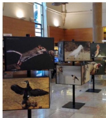
El Centro de Documentación del Agua albergó la exposición